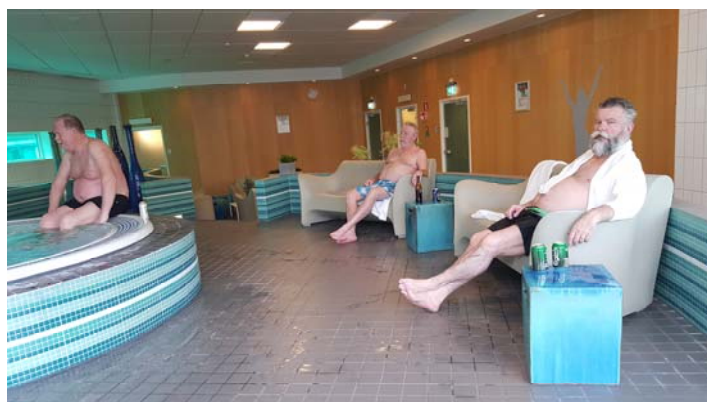
En ögonblicksbild från relaxen 2017, Bild #311