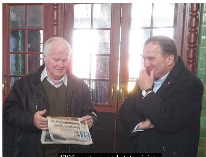
#306 samt en road statsminister