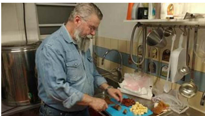
Korv och ost smakar bra till ölprovning.

Nu är vi då framme vid det som är själva grejen med besöket. Vi var 6 st Kennet h som avsmakade några riktiga delikatesser först en IPA vid namn "Born To Die". Egentligen en klon på ett öl från Brew Dog med samma namn. Den andra var ett litet experiment med ekspån, som kallades "Midnight", en kraftig Stout med ek-karaktär. Samt några köpeöl för att ha någonting att jämföra med. Där de egna brygderna vann överlägset. Lite tilltugg och många roliga historier gjorde kvällen till en strålande tillställning. Alvéns och hans kumpaner som kallar sig BBB (någonting i stil med Beer Brewing Boys) skall ha all heder av denna smakupplevelse som jag hoppas vi kan återupprepa var det lider.