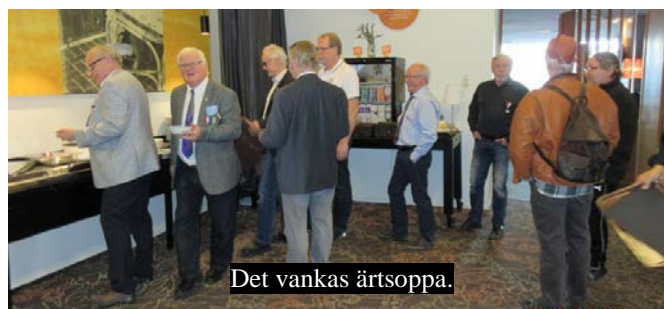
Det vankas ärtsoppa.