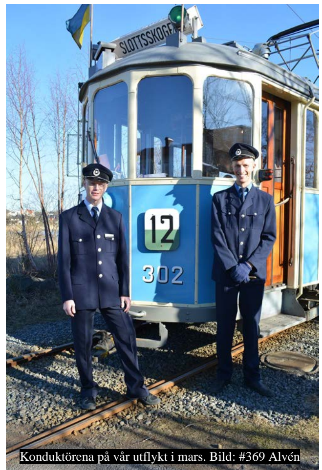
Konduktörerna på vår utflykt i mars.