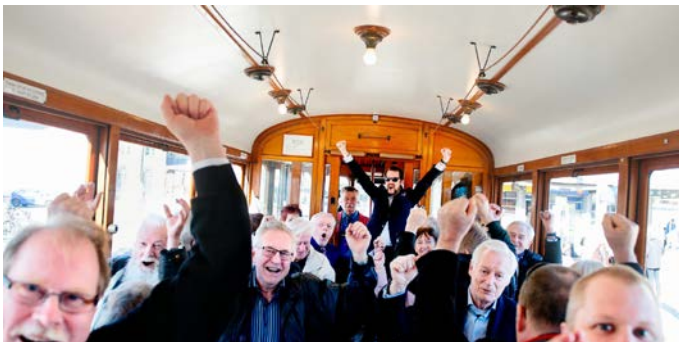
Så här glada blev vi när vi slagit världsrekord.

Klockan blir så två och vi kör igång. Alla får ett exemplar av Kenneth hs nationalsång och vi klämmer i med första versen. När sången är färdig bryter jubel ut i vagnen ty vi har slagit världsrekord.