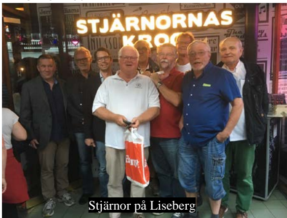
Stjärnor på Liseberg