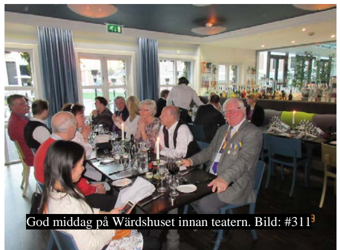
God middag på Wårdshuset innan teatern. Bild: #311 9

Middag på Lisebergs Wårdshus och här var det fler respektive som slöt upp. Efter ett välkomnande från personalen kom så förrätten in som för dagen var lättrokt fjällröding. Förrätten var nog inte tillända innan Apotekarn drog sin första historia. Det skulle bli många fler under kvällen, mer eller mindre framgångsrika.