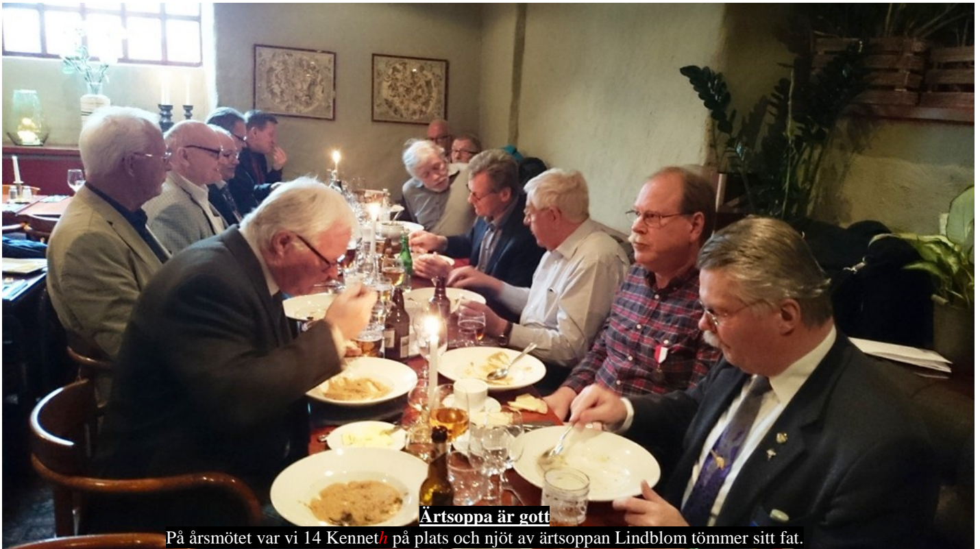
Ärtsoppa är gott