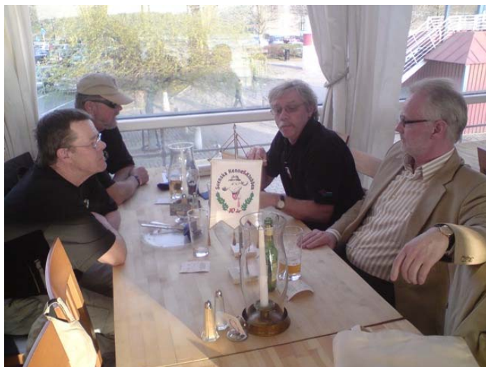
Diskussioner om ditt och datt på minnesdagen

På S/S Marieholm avnjöts det en gravöl i åminnelse av vår kära, djupt saknade årsdag. Allt i goda vänners lag givetvis. Efter gravölen blev det muntrare stämning och allt mellan himmel och jord diskuterades. Mycket positivt denna dag var att några nya medlemmar hade hittat till S/S Marieholm för att stifta bekantskap med oss övriga i klubben.